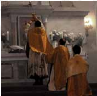
Tridentin rítusú szentmise