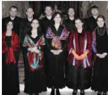
Villő Énekegyüttes & Voces Æquales